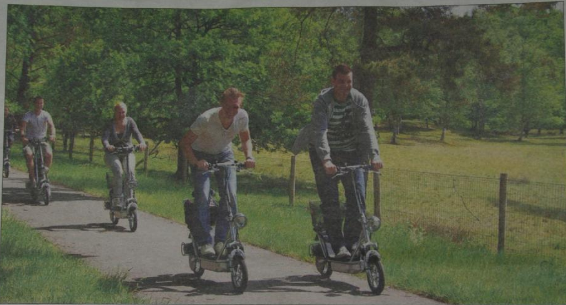
De Veluwe Specialist is het enige bedrijf in Nederland dat de e-step verhuurt. Met deze gemotoriseerde tweewielers kunnen klanten op zoek naar de mooiste bezienswaardigheden van de Veluwe